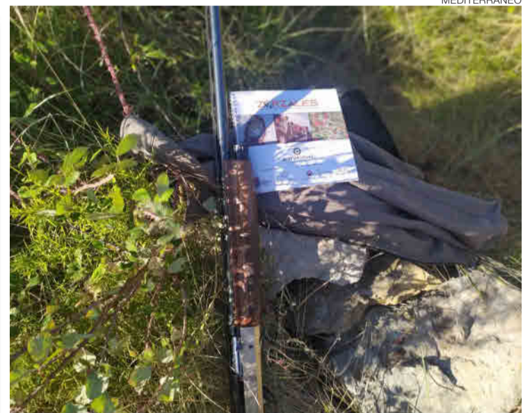
► Tres clubs de la provincia participan en el Proyecto Zorzales.

DISTINTAS ESPECIES // Otra de las formas de participar en el Proyecto Zorzales y en el censo de otros animales es a través del Observatorio Cinegético. Para ello es importante saber diferenciar bien a las distintas especies que hay, «se pueden avistar cuatro clases distintas