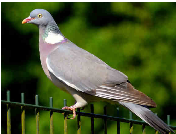
La paloma torcaz es una de las especies que ya se pueden abatir.

La orden de vedas llevada a cabo por la Conselleria de Agricultura, Desarrollo Rural, Emergencia