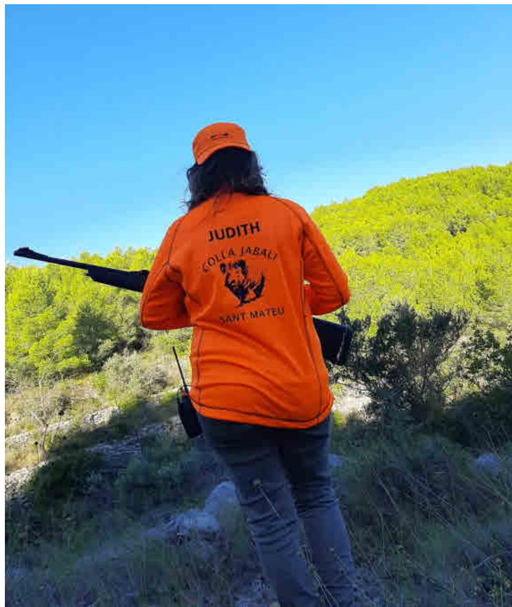
Monte > Una cazadora otea el horizonte en busca de los jabalís.

Asimismo, a todo ello, hay que sumarle los accidentes de tráfico que causa su presencia inesperada en la vía. Solo en las carreteras de la Comunitat se registraron 92 accidentes originados por jabalíes en 2009, ascendiendo en 2019 a 669 casos, según muestran los datos registrados por la Dirección General de