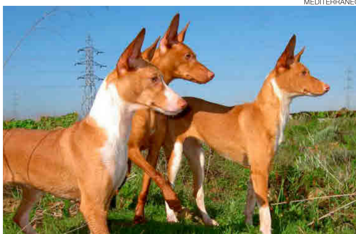
El podenco ibicenco y andaluz será protagonista en la Poble Tornesa.

El próximo 18 de septiembre se celebrará en la Poble Tornesa el X Campeonato de Podenco Ibicenco y Xarnego. Esta modalidad de caza, con muchos aficionados en la provincia de Castellón, destaca por la destreza y coordinación de los perros. «Es una competición muy visual, en la que se pueden ver grandes carreras de los perros por el monte y la organización de los perros a la hora de trabajar en