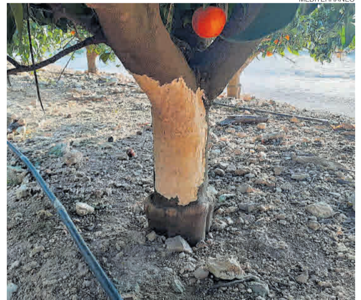
Cultivo ▶ Imagen de daños ocasionados en un árbol por los conejos.

ca que permite acceder a más zonas porque no se utilizan armas para su realización. «Con los perros podemos cazar en huertos con cosechas pendientes, como los campos de cítricos. Sin embargo, con una escopeta no podríamos acceder. Además, es una modalidad más fácil de compatibilizar con los demás usuarios del monte al no llevar escopeta», señala Varela.