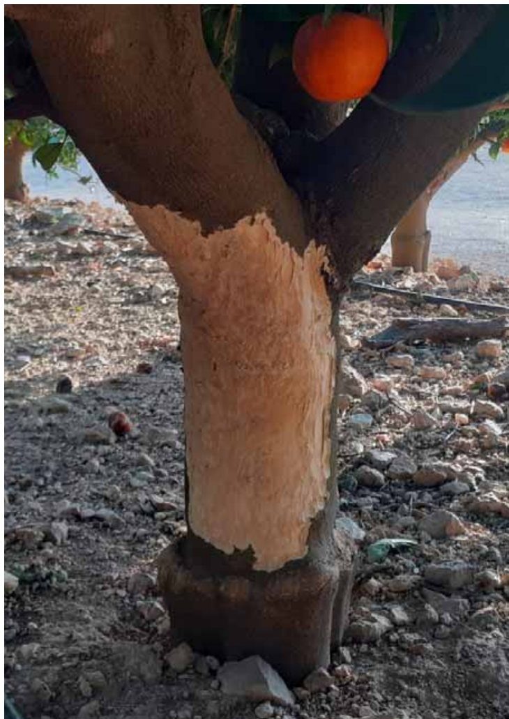
Imagen de algunos de los daños provocados por conejos en los naranjos.

Sin embargo, la temporada general no es la única medida cinegética que controla la población de la fauna salvaje, a esta se le suma el periodo de la caza con perros y sin armas, centrada en los conejos, que se inició el 17 de julio, y las batidas de jabalí, que comenzaron el 1 de septiembre. «La labor que realizamos los cazadores es esencial para evitar las diferentes problemáticas que producen las sobrepoblaciones de distintas especies, entre las que figuran los accidentes de tráfico, los